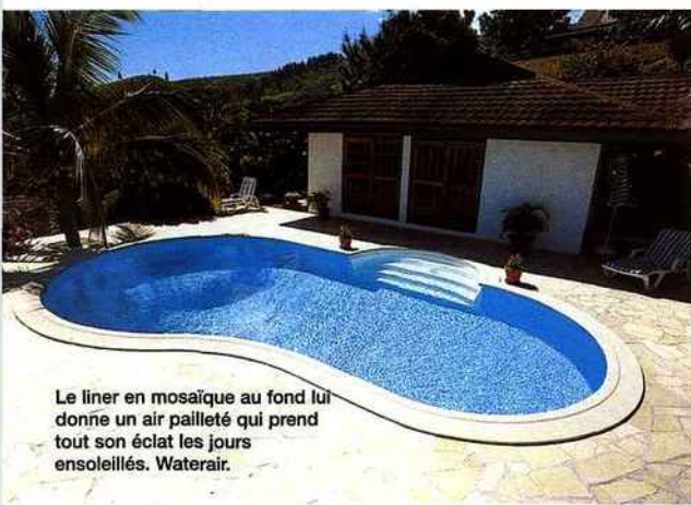
Le liner en mosaïque au fond lui donne un air pailleté qui prend tout son éclat les jours ensoleillés. Waterair.

tombent pas dans le bassin, des barrières escamotables sont disponibles pour toutes les tailles. Pas d'inquiétude, elles ne vont pas pour autant ruiner l'harmonie rêvée des fournisseurs prévoient la nature du sol dans lequel la barrière s'intègre et