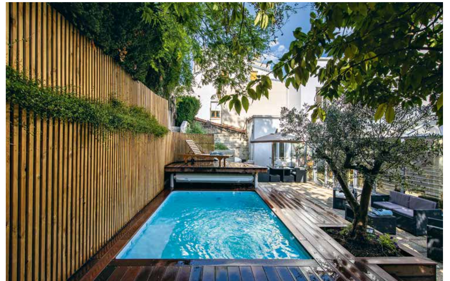
Même dans les petits jardins comme celui-ci, une piscine se révèle une idée qui valorise votre patrimoine tout en rendant la maison et le jardin conviviaux. Faire appel à un paysagiste dès la conception vous permettra d'envisager un projet qui répond à vos attentes et de bénéficier de conseils personnalisés pour l'implantation et les contraintes techniques d'installation. L'Atelier des Paysages et des Jardins.