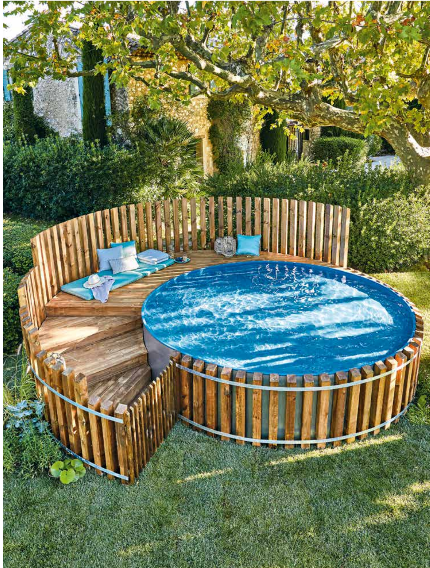
Un des avantages de la piscine hors sol en acier, c'est qu'elle s'installe très facilement. Elle est dotée d'une paroi en acier durable qui tient toute l'année, même hors saison. A vous d'imaginer des aménagements, en bois comme ici ou autres, pour l'intégrer au mieux dans votre environnement. Bestway.