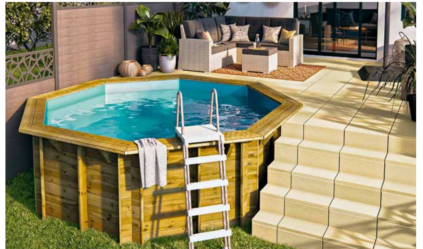
Chaleureuse et authentique, la mini piscine en bois présente l'avantage de s'intégrer facilement sans jamais dénaturer l'harmonie de l'environnement. Proposée en kit, elle se monte facilement grâce à son système d'emboîtement du bois. Piscine Sunwater d'Ubbink chez Leroy Merlin.