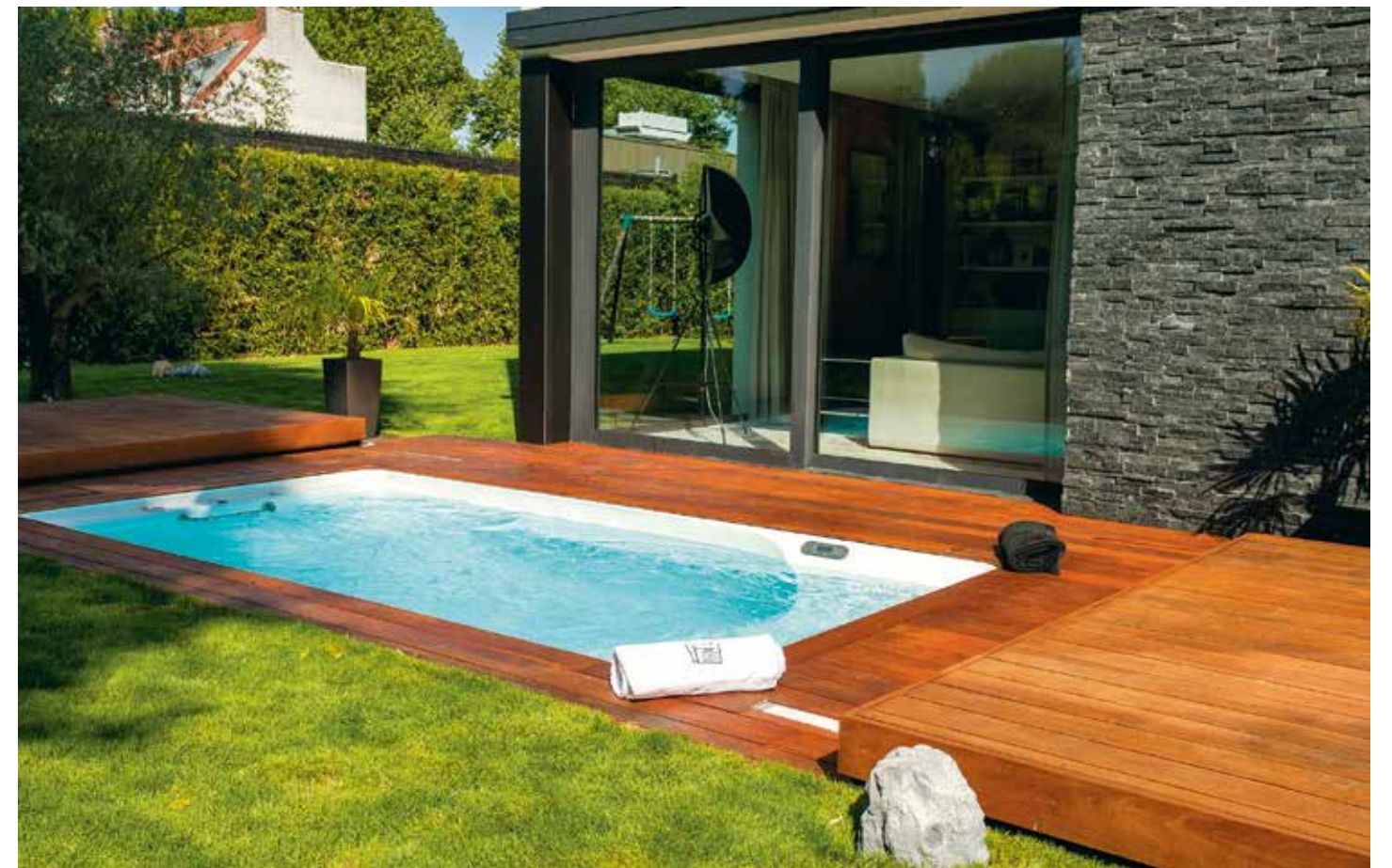
Très agréable, la piscine avec jacuzzi intégré possède deux zones bien distinctes, dont l'une est équipée de buses de massage. Le spa est installé dans la partie la moins profonde et il est possible d'utiliser les deux espaces séparément ou simultanément. Piscine Aquilus