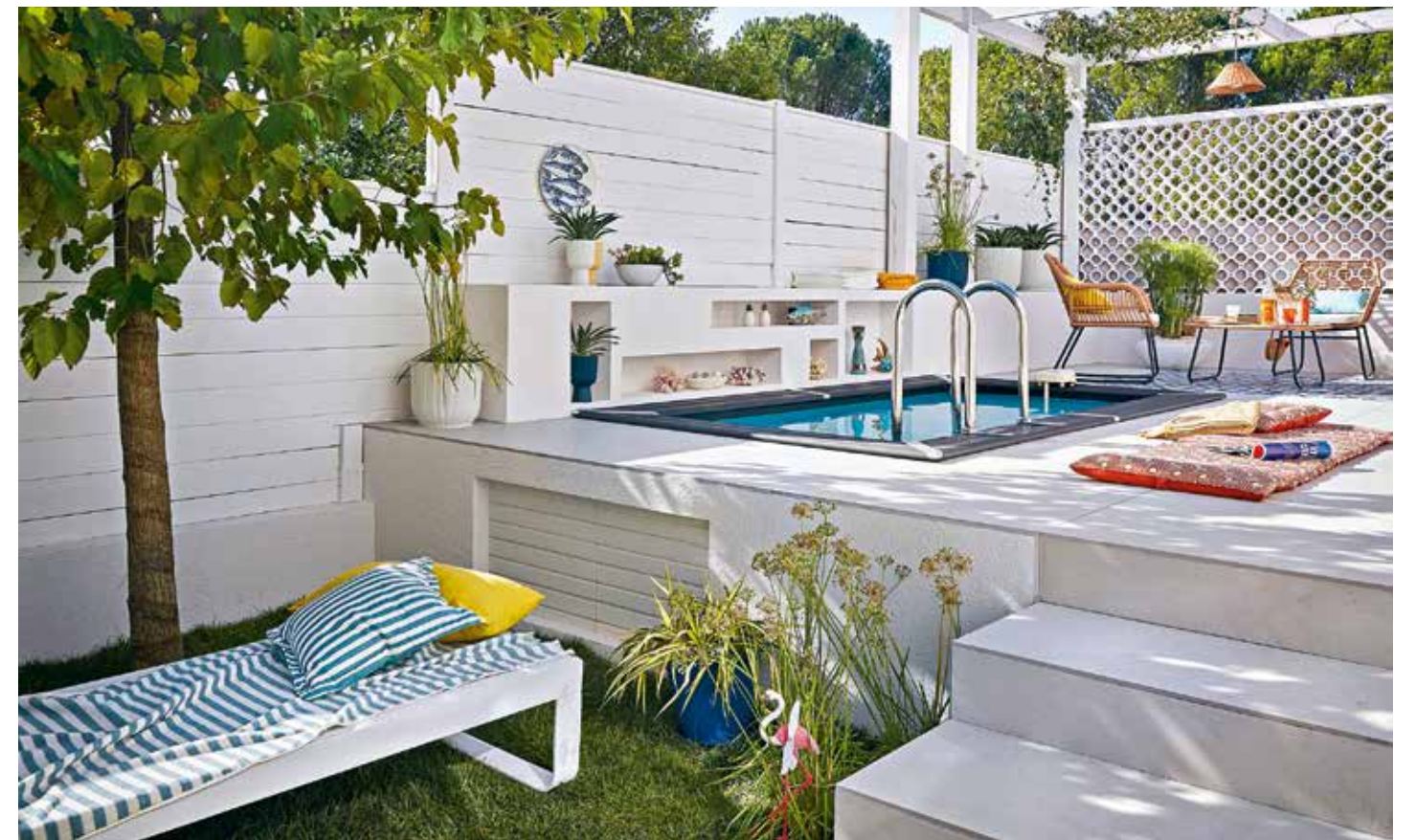
Comme dans un appartement, un petit espace extérieur doit être travaillé avec soin. Listez vos envies, vos contraintes, vos couleurs préférées... puis imaginez comment vous allez vivre avec et autour du bassin. Un aménagement simple mais cohérent comme celui-ci, avec la teinte dominante de blanc, fonctionne à merveille. Piscine hors-sol rectangulaire Gré Leroy Merlin .