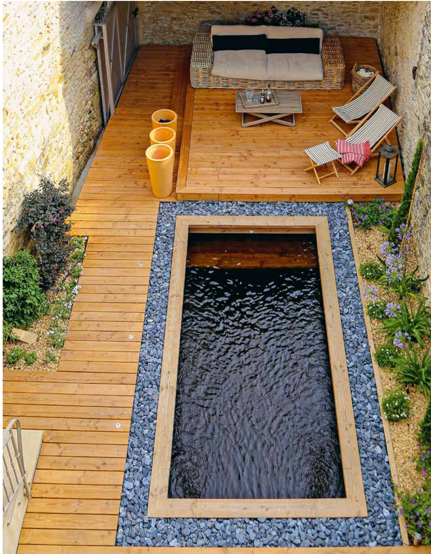
Le bois n'est pas réservé aux piscine hors sol. Celle-ci est en pin d'Orégon et bénéficie d'une filtration Biologique Intelligente et Connectée Biopoolsafe. Côté sécurité, le must, ce sont les volets roulants, notamment immergés comme ici. Esthétiques et simples à manipuler, ils se dissimulent directement dans un caisson sous l'eau. Optez plutôt pour un boîtier qu'une télécommande que l'on perd sans arrêt ! Piscine Biopooltech .