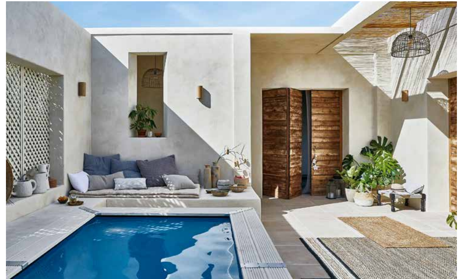
Sécurité avant tout ! Depuis 2003, la loi vous oblige à protéger votre piscine, qu'elle soit grande ou petite ! Le moins onéreux, c'est la bâche à barre. Les plus petits peuvent tomber et marcher dessus sans risquer la noyade. La barrière de piscine est la solution de sécurité permanente, elle peut faire partie intégrante de l'esthétique du jardin, voire être totalement invisible. Les alarmes, discrètes, préservent l'esthétique du jardin, mais il faut garder un œil et une oreille aux aguets !