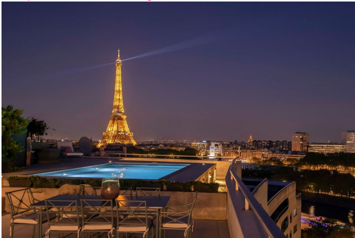
Trophée 2023 - Catégorie "Piscine installée par un particulier" >