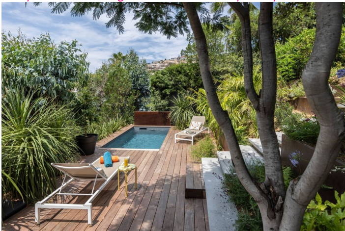
Trophée 2023 - Catégorie "Piscine installée par un particulier" >