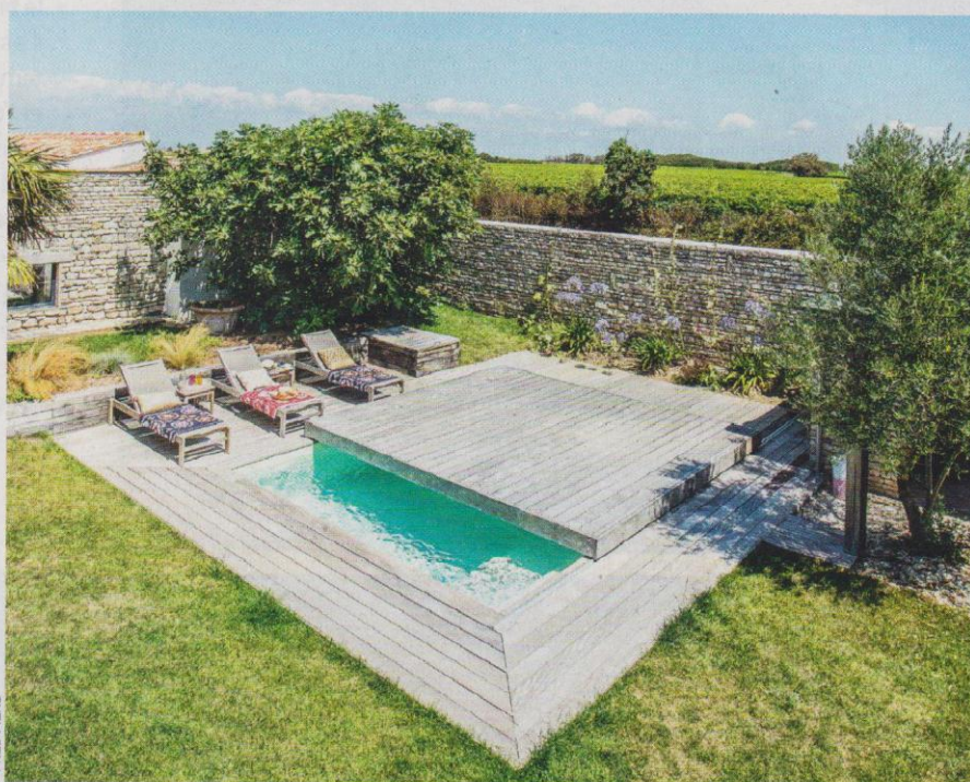
Ci-dessus. Structure en aluminium double-peau revêtue d'un liner. Filtre à sable, désinfection au chlore. Rolling-Deck® sur rail et entourage en Ipé. En option, régulation de pH et injection de chlore semi-automatisé. L4 x L2,5 x P1,36 m. Prix à partir de 20000 € hors installation. PISCINELLE

En l'absence de systèmes de contrôle et de gestion entièrement automatisés, on doit vérifier au moins une fois par semaine le pH et le taux de désinfectant à l'aide d'un testeur ou d'une trousse d'analyse. En début de saison, il est conseillé d'apporter un échantillon d'eau de sa piscine à un professionnel pour qu'il l'analyse de façon plus précise, en étudiant de nombreux autres paramètres. Il indique ensuite, si nécessaire, les corrections à apporter. Il est ensuite plus facile de maintenir un bon équilibre en évitant une surconsommation de produits.