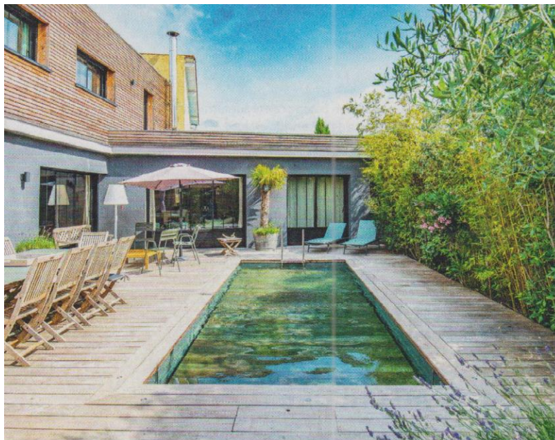
Ci-dessus. Son fond mobile « Aqualift » remonte jusqu'à masquer cette piscine en béton armé isolé (moins 23 % de coût de chauffage). Membrane armée, filtre à sable, régulation automatique du chlore et du pH. L5 x L2 x P1,90 m. Prix sur devis. Réalisation Aqua System Solutions (78840 Freneuse). L'ESPRIT PISCINE