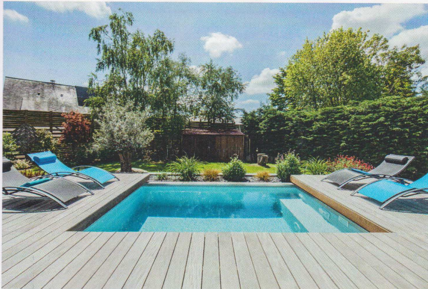
4 x 2,49 m pour cette mini-piscine équipée d'un escalier banquette et d'une plage en bois. Architecte Maud Selles (SMOL Architecture). Réalisation l'Esprit Piscine.

Le nombre de possesseurs de piscine a explosé depuis l'arrivée des mini-bassins, simples ou équipés de couloirs et spas de nage.