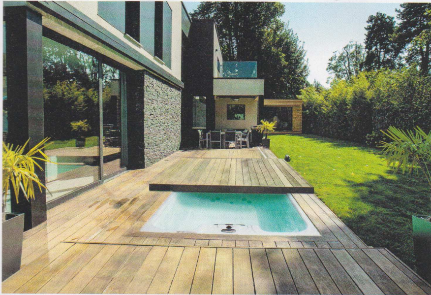
Mi-piscine, mi-spa, un concept qui séduit. Ce bassin est doté d'un dispositif de nage à contre-courant et complété par une gamme d'équipement de fitness. 22 700 €. Aquilus.

Le nombre de possesseurs de piscine a explosé depuis l'arrivée des mini-bassins, simples ou équipés de couloirs et spas de nage.