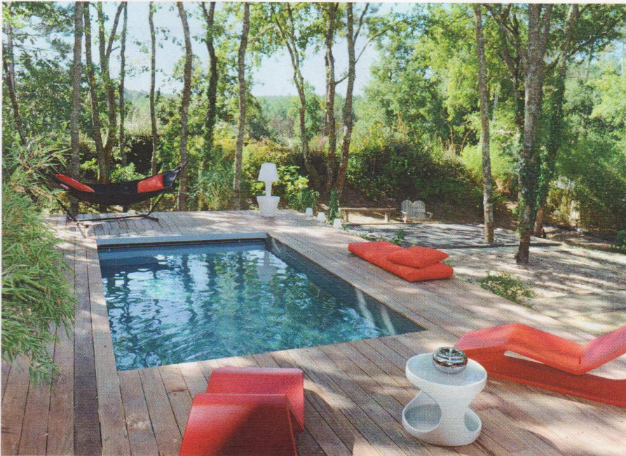
Assez vaste pour s'ébattre, mais encore très logeable, le modèle Cr6. 5,99 x 2,94 m, soit 17,6 m 2 . À partir de 9 518 €. Piscinelle

Les dispositifs connectés dédiés à la piscine se multiplient, facilitant à la fois l'entretien du bassin et sa sécurisation.