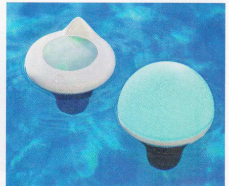
Cet objet flottant intelligent et lumineux analyse l'eau en temps réel. 459 €. Ofi.

On savait depuis quelques années que divers appareils étaient capables de faciliter l'entretien de la piscine. Mais aujourd'hui, on ne se contente pas de l'aide de ces appareils, on veut les commander à distance et qu'ils se parlent entre eux pour une meilleure gestion de l'installation. C'est ce qu'on appelle une piscine intelligente, gérée par la domotique. Niveau d'eau, température, taux de pH, de désinfectant, éclairage, consommation d'électricité, durée de filtration ou pilotage de l'électrolyse, tous les besoins du bassin sont désormais contrôlables et réglables depuis un afficheur, le plus couramment utilisé étant bien sûr le smartphone, via des applications dédiées. Ceci pour l'entretien. Mais ce n'est pas tout ! La sécurisation de la piscine fait également partie du champ d'application de