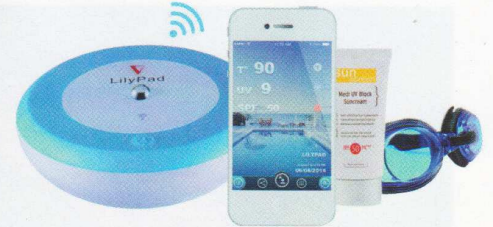
LilyPad, un flotteur connecté au Wifi qui mesure la température de l'eau et les UV. 99 €. Lilypad.

Les chiffres du secteur l'attestent : nous sommes de plus en plus nombreux à nous jeter à l'eau ! Devant cet engouement, le marché de la piscine est étudié de près par les professionnels pour répondre au mieux à l'attente des consommateurs. Quatre grandes tendances ressortent de ces observations. Des bassins connectés, plutôt petits, naturels et paysagés, voilà ce que nous voulons, et ce à quoi répondent les nouveautés des professionnels.