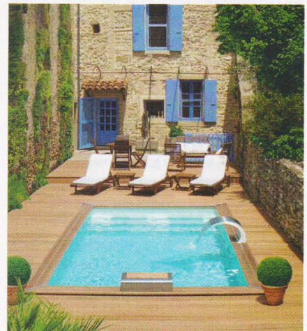
Le modèle Cr4b, 2,50 x 4 m, est l'un des plus vendus. À partir de 8 219 €. Piscinelle.

secteur ont donc mis à leur catalogue de plus en plus de modèles « réduits », mesurant 4 x 3 m en moyenne, soit 15 m 2 , ce qui est très suffisant pour se rafraîchir et s'amuser en famille. Il en existe même de moins de 10 m 2 . Les prix pour ce type de bassin s'étalent de 2 000 € environ à 9 000 €, selon qu'il s'agit d'un kit hors sol, d'un modèle semi-enterré ou d'une piscine enterrée. Les couloirs de nage à contre-courant sont une formule qui gagne du terrain, occupant peu d'espace, mais permettant aux plus sportifs de pratiquer leur hobby. D'autres modèles associent la nage à contre-courant et les bienfaits du spa. Bien sûr les prix des bassins équipés de ce type de technologie affichent des prix plus élevés qu'un bassin non équipé. Les comparatifs 2019 indiquent des tarifs de 3 500 à 15 000 € pour l'installation d'un spa de nage.