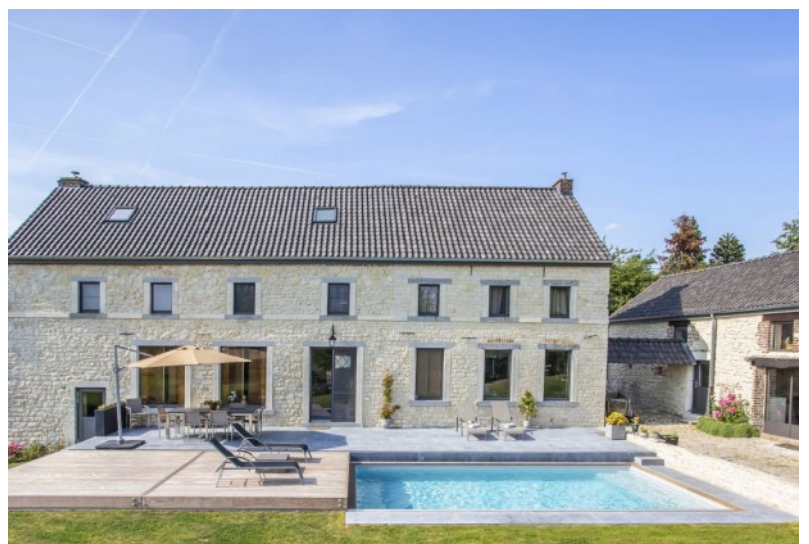
Cette piscine a été récompensée par le Trophée d'Or de la FPP dans la catégorie « Rénovation de piscine »