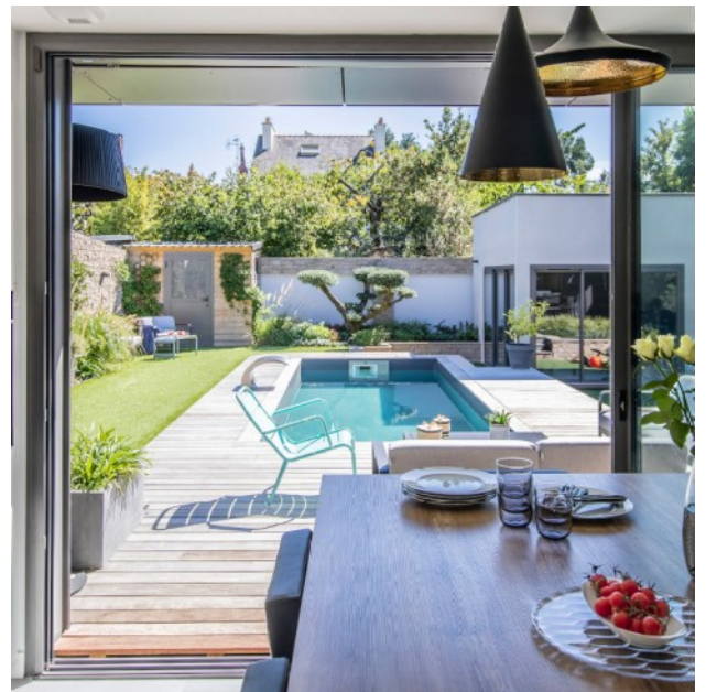
Ci-dessus, un sentiment d'être en vacances depuis sa cuisine grâce à la présence de la piscine.