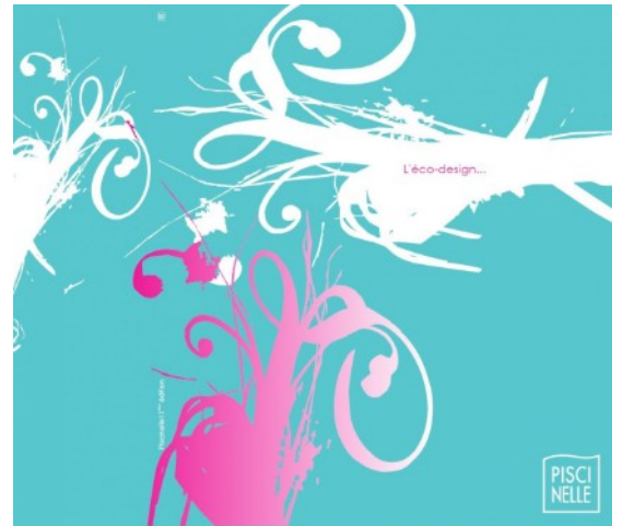
Couverture de la 11ème édition du catalogue Piscinelle.