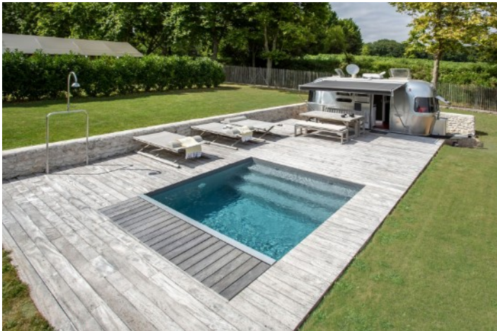
Une Piscinelle à l'âme voyageuse... >