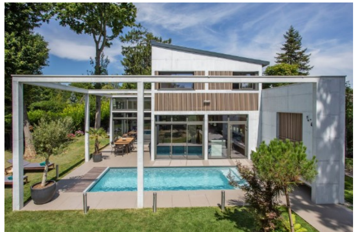
La piscine, ce luxe permis >