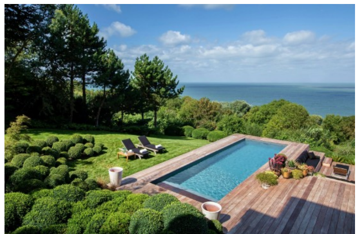
Luxe, calme et volupté...