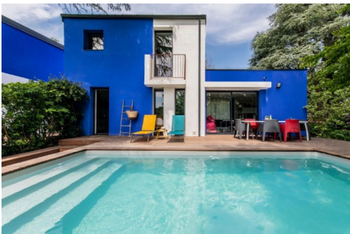
Une Piscinelle comme dans le jardin Majorelle >