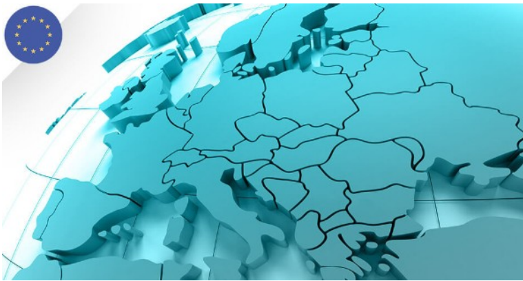
Piscinelle.com en anglais vise à répondre aux demandes européennes.

Pour répondre à la demande émanant de plusieurs pays d'Europe notamment, Piscinelle a décidé d' ouvrir son site en version anglaise .