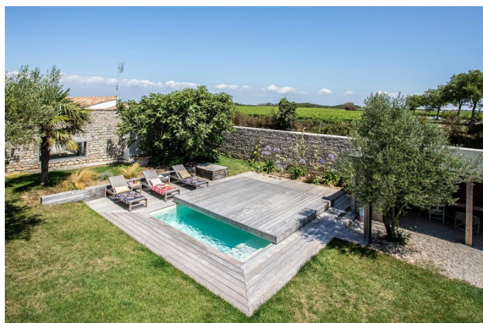
L'Île de Ré : à deux pas de la plage... une piscine ?