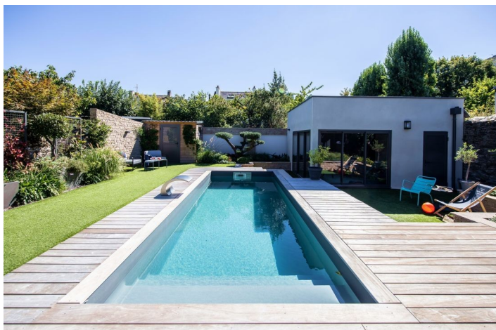
Nantes : la quintessence de la piscine de ville contemporaine