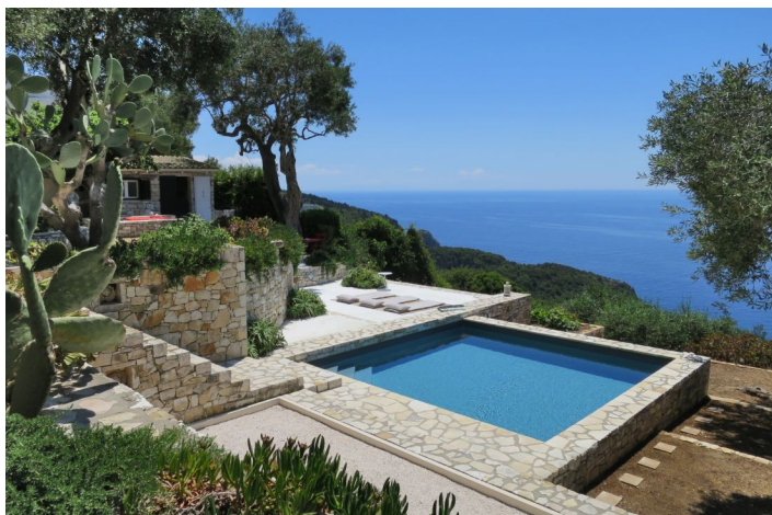
Grèce : l'émotion de l'Histoire