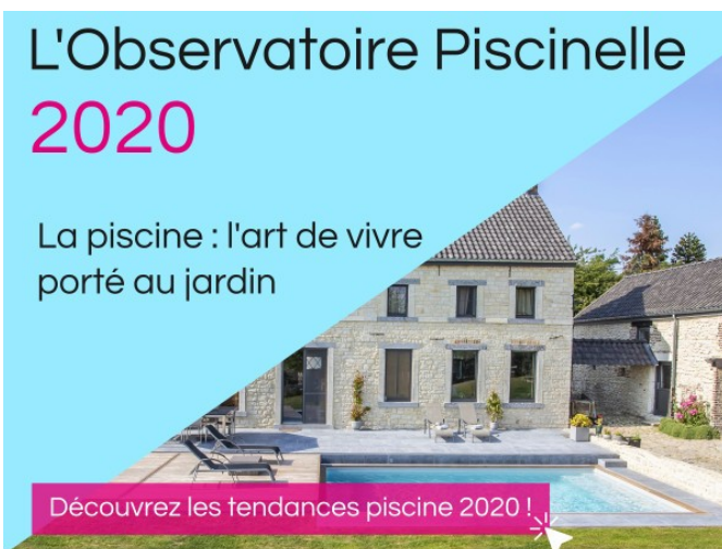
Retrouvez l'Observatoire Piscinelle complet en fin de dossier.

Parce que notre mission chez Piscinelle est d'apporter des solutions industrielles innovantes autant qu'une vision plus générale de la Piscine , nous avons créé l'Observatoire Piscinelle, étude réalisée à partir de sondages auprès de prospects avant leur achat ainsi que synthèse des principales caractéristiques des Piscinelle commandées par nos clients.