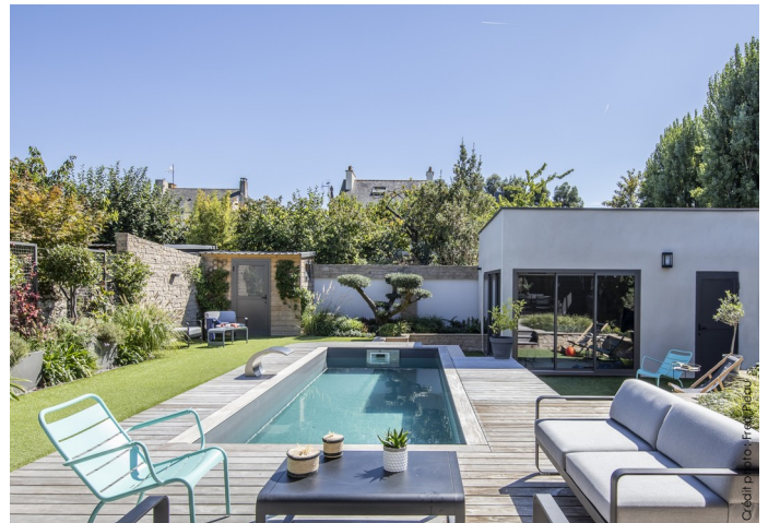
Cette Piscinelle, installée par son propriétaire, a obtenu le Trophée d'Or 2018 de la piscine installée par un particulier décerné par la Fédération des Professionnels de la Piscine.

La notion de kit répond à plusieurs aspirations chez nos clients. Celle de l'épanouissement personnel d'abord, qui consiste à faire soi-même les choses de ses mains. Mais le diy c'est également une manière très efficace de maîtriser son budget (7000 € d'économie constatée en moyenne). Enfin, monter soi-même sa piscine permet de gérer parfaitement son planning et de possiblement prendre une décision en mai pour se baigner en juillet.