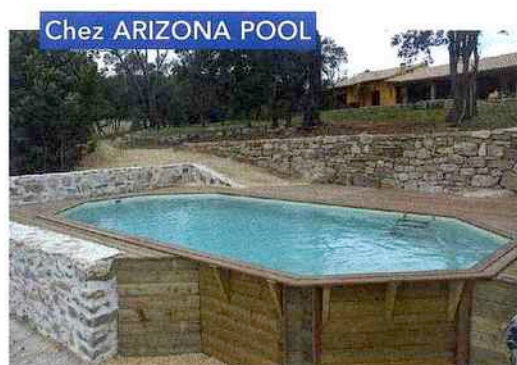
Chez ARIZONA POOL

Piscinelle utilise le pin rouge d'origine scandinave pour la structure de ses piscines et l'iron wood (ou Ipé) pour les margelles. Le bloc technique centralise toutes les commandes et peut intégrer des fonctions complémentaires comme la nage à contre-courant et l'éclairage.