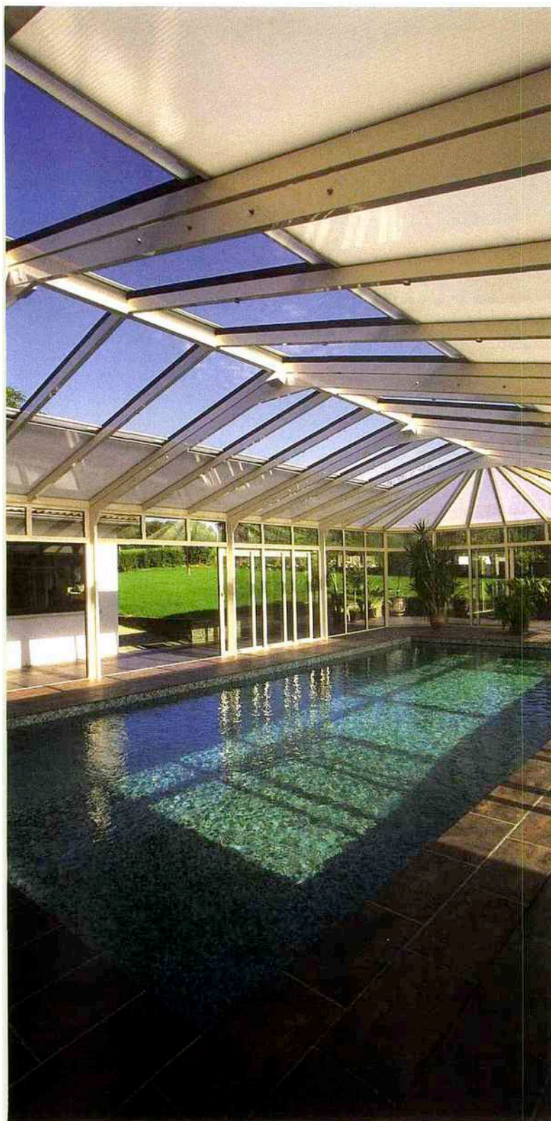
Contemporain, classique ou rétro, l'abri de piscine Import Garden peut s'adapter au style de la maison afin de s'intégrer harmonieusement. Les profilés sont en aluminium thermolaqué avec ou sans rupture de pont thermique. www.importgarden.net .