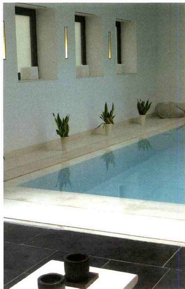
La société construit des piscines sur mesure depuis 1967 et plus particulièrement des réalisations intérieures. Ambiance africaine et contemporaine en pierre naturelle et qui évoque l'atmosphère du hammam. www.idoine-piscines.com .