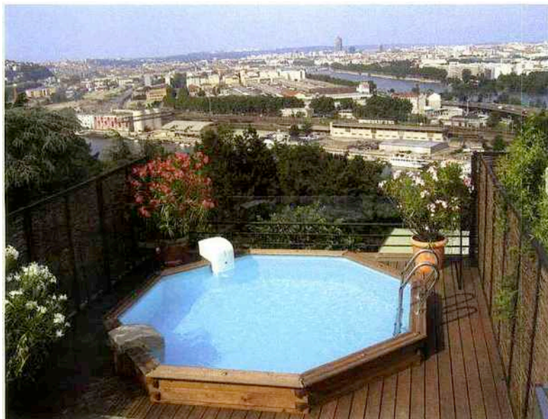
Galion fabrique ses margelles avec du teck birman provenant exclusivement de zones à reforestation contrôlée.