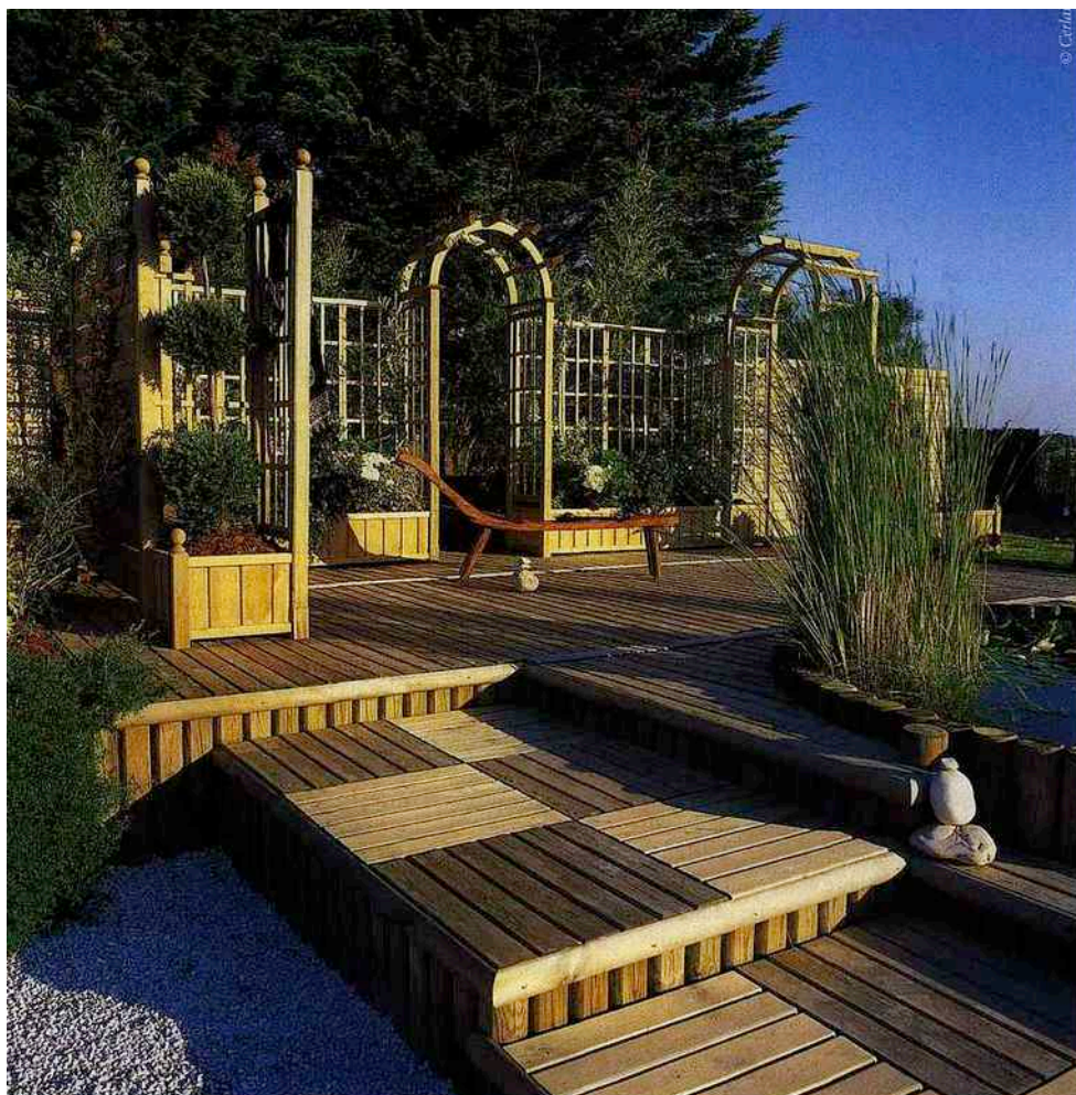
LES CAILLEBOTIS PERMETTENT DE CRÉER DES MOTIFS ET DIFFÉRENTS NIVEAUX POUR UN RÉSULTAT ORIGINAL ET RÉUSSI.