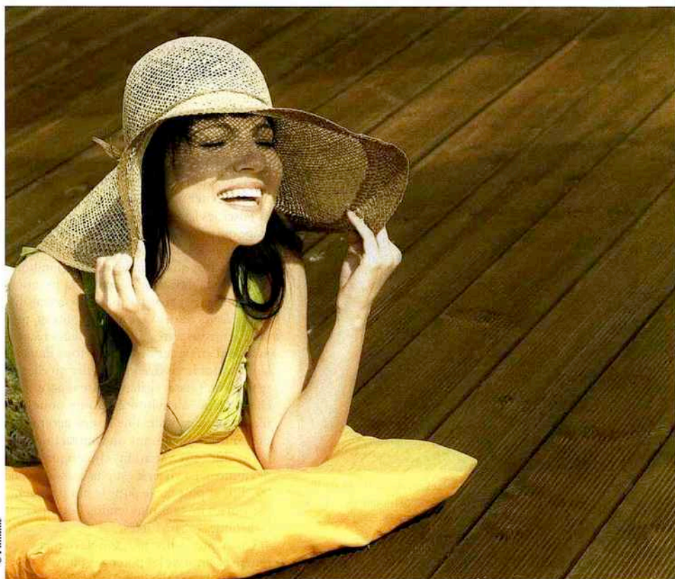
PRENDRE LE SOLEIL SUR SA TERRASSE EN BOIS, UN MOMENT DES PLUS CHALEUREUX.