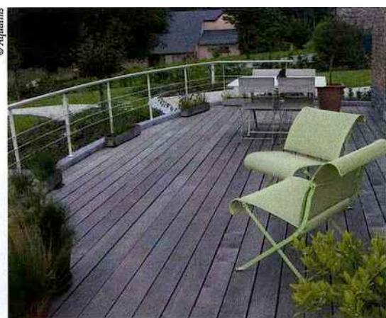
PASSAGE DE L'INTÉRIEUR VERS L'EXTÉRIEUR, LA TERRASSE EN BOIS S'HARMONISE AVEC LE JARDIN.