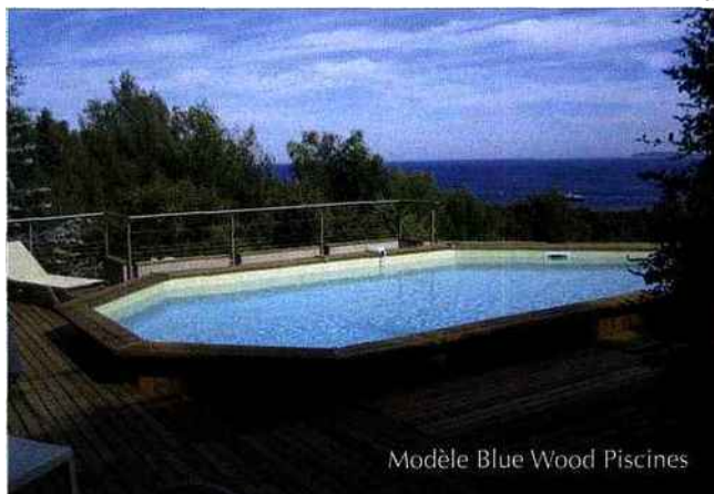
Modèle Blue Wood Piscines

Lieu de détente, la piscine est aussi un lieu de convivialité : elle offre un cadre de choix pour les déjeuners ou les dîners. Barbecue et rangements deviennent alors indispensables... Reste qu'il est préférable alors de ne pas être trop loin de la maison... «Pour profiter vraiment et pleinement de son bassin, il ne faut pas avoir de grandes distances à parcourir. Plus il est accessible, plus il est utilisé», note encore Mme Beauquesne. ↵