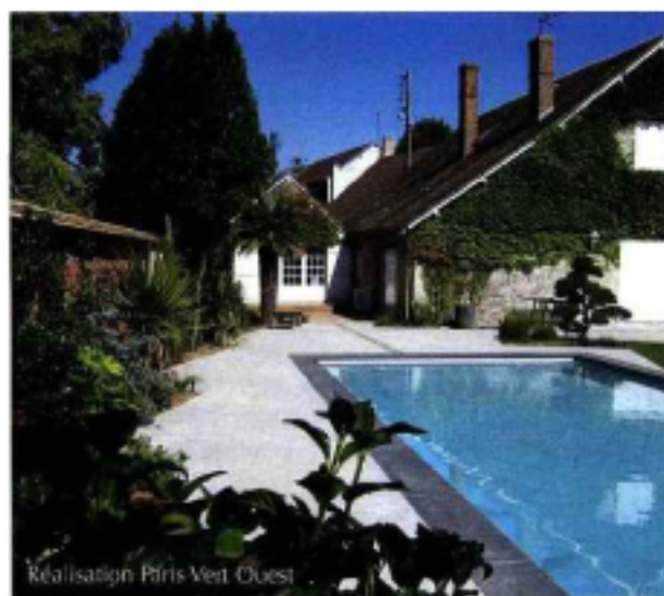
Réalisation Paris Vent Ouest

Source de détente et de bien-être, la piscine est, pour qui veut allier convivialité et activités sportives, un équipement de choix. Petits et grands, amis et famille se retrouvent avec plaisir au bord du bassin pour des moments décontractés et joyeux.