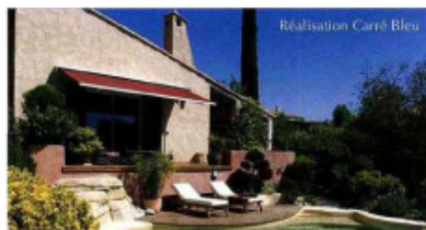
Réalisation Carré Bleu