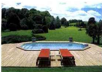
▲ Cette piscine à la plage réalisée tout en bois s'accorde parfaitement dans le paysage. Piscinelle RG 8.

► Ligne classique pour une composition à l'esthétique irréprochable. Aquilius Piscines, Bora.