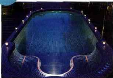
Le spa de nage est conçu pour vous

offrir un bien-être total. Son parcours de massages est diversifié afin de répondre à toutes les attentes : massages toniques, relaxants, activités de détente, gym aquatique... Afin de stimuler tous vos sens, ce modèle est également équipé d'un système innovant de chromothérapie et d'aromathérapie.