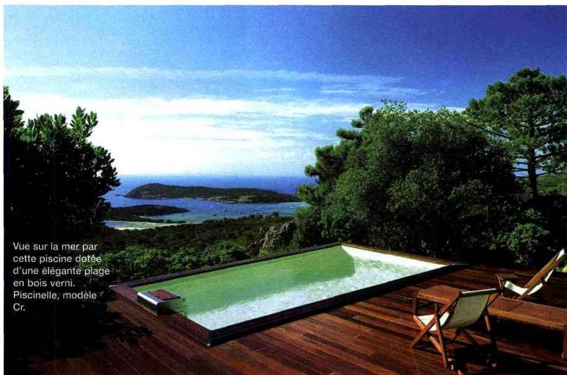
Vue sur la mer par cette piscine dotée d'une élégante plage en bois verni. Piscinelle, modèle Cr.

► Ligne classique pour une composition à l'esthétique irréprochable. Aquilius Piscines, Bora.