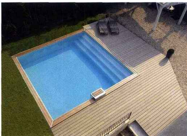
Parmi les 8 modèles aux formes variées, "Bo" ose le carré parfait, Piscinelle Bo (6 dimensions et 3 profondeurs) est en lames de pin rouge certifié (PEFC) emboîtées à rainure et languette. Ces parois se tiennent par un assemblage à mi-bois assurant la solidité de la cuve. Bo est ici dotée d'un Escabanc, à la fois escalier immergé et banc, où s'asseoir. Les bassins de la marque peuvent être couverts d'un système Aqualift® : une plate-forme qui monte et descend. En position haute, elle interdit l'accès à l'eau. Un filtre à Média polyester garantit une filtration fine sans produits chimiques. Piscinelle