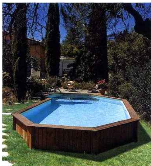
Sur un cadre en acier galvanisé, des parois en bois (pin autoclave classe 4) constituent le corps de la cuve. Des margelles en ipé entourent le bain, tandis qu'un liner assure l'étanchéité. Cette technique souple, développe 9 formes, déclinées en 84 modèles munis d'un groupe de filtration - à sable - complet. Beaver Pool.