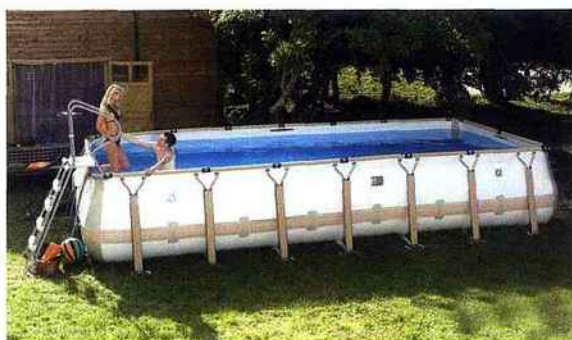
La piscine KD Teck dispose d'un groupe de filtration à sable, relié au bassin par un skimmer et une buse de refoulement. Une échelle de sécurité interdit l'accès en l'absence d'adulte. KD Teck, en 4 tailles : 3 x 5 m / 3 x 7 m / 4 x 8 m / 5 x 10 m. Piscine Zodiac, Adeva.

Si le froid de l'hiver vous a fait remettre à plus tard vos plans piscine, il est encore temps d'envisager de prendre un bon bain sous le soleil. Les retardataires ont désormais leur solution avec les modèles de piscines hors sol . De la filtration la plus fine au chauffage aérothermique , le petit bassin ne vous refuse rien. Par Claude Jestin