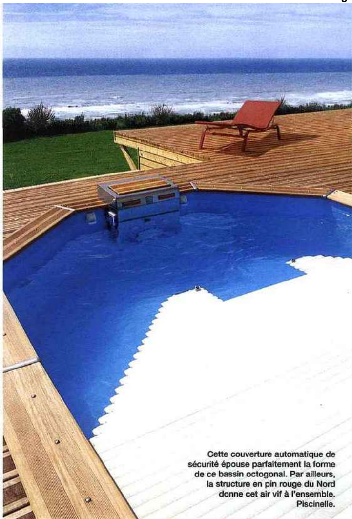
Cette couverture automatique de sécurité épouse parfaitement la forme de ce bassin octogonal. Par ailleurs, la structure en pin rouge du Nord donne cet air vif à l'ensemble. Piscinelle.