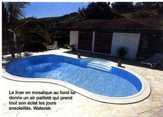
Le liner en mosaïque au fond lui donne un air pailleté qui prend tout son éclat les jours ensoleillés. Waterair.

tombent pas dans le bassin, des barrières escamotables sont disponibles pour toutes les tailles. Pas d'inquiétude, elles ne vont pas pour autant ruiner l'harmonie rêvée : des fournisseurs prévoient la nature du sol dans lequel la barrière s'intègre... et