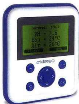
TROPHÉE D'OR : KLEROO Pilote de toutes les fonctions : filtration, traitement de l'eau, chauffage, éclairage, entretien, nettoyage... Klereo contribue au respect de l'environnement en régulant la filtration en fonction des conditions climatiques, ainsi qu'en maîtrisant le temps d'éclairage ; en économisant les produits d'entretien, par régulation du pH et dosage de désinfectant.

POUR UN PRODUIT, UN ACCESSOIRE, UNE TECHNIQUE DE CONSTRUCTION OU UNE INITIATIVE CONTRIBUANT PARTICULIÈREMENT AU RESPECT DE L'ENVIRONNEMENT.