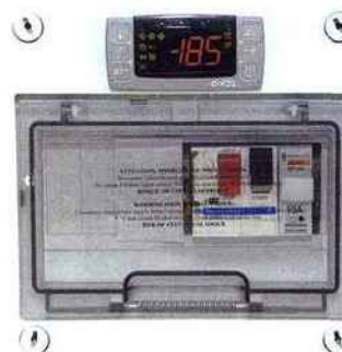
TROPHÉE D'ARGENT : PROCOPI Cerland - coffret électrique de filtration automatique : optimise et ajuste automatiquement la durée de filtration en fonction de la température de l'eau, permettant de générer des gains de consommation électrique et d'améliorer la filtration pour des températures supérieures à 25 °C.