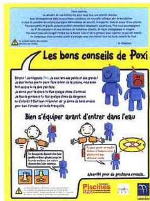
TROPHÉE D'ARGENT : CARRÉ BLEU / CARRÉ BLEU INTERNATIONAL (26) Poxi Carré Bleu et Techniques Piscines Spas le magazine donnent rendez-vous aux lecteurs avec "Les bons conseils de Poxi". Publications de ces conseils au fil des parutions.