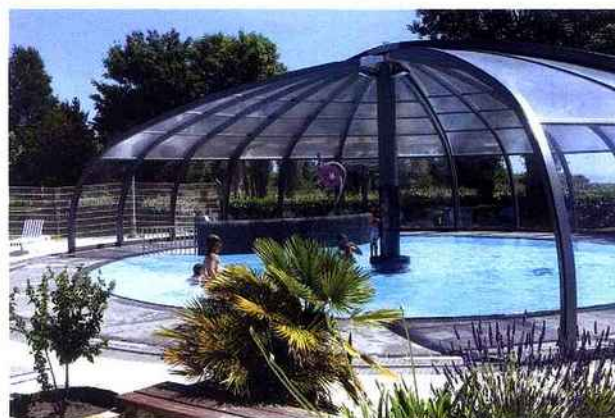
TROPHÉE D'ARGENT : SUN ABRIS (34) Modèle : Tourne Sun, s'adapte sur des piscines rondes. Abri de grande largeur, jusqu'à 50 mètres.