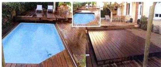
TROPHÉE D'OR : PORTELLI FRÈRES (31) Piscine "tiroir". Dimensions : 7 m x 3 m à fond plat. Réalisation de deux terrasses en bois exotique, sur structure métallique, dont une de type "tiroir". La terrasse vient disparaître sous l'autre terrasse.

POUR LA CRÉATION D'UN MATÉRIEL, D'UNE INITIATIVE, D'UNE ACTION D'INFORMATION, ETC., FAVORISANT LA SÉCURITÉ AUTOUR DE LA PISCINE.