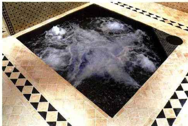
TROPHÉE D'ARGENT : CARRE BLEU / CONCEPT ET CREATION (91)

Dimensions : 2 m x 2 m x 1,10 m, revêtement en mosaïque noire, chauffage par échangeur de chaleur, projecteur à Led multicolores, buses de massage, Air blower, système de déshumidification.