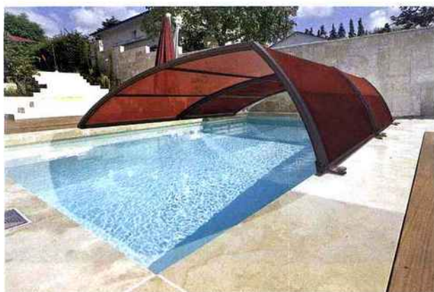
TROPHÉE D'OR : ABRISUD (32) Abri Techstyle : 1 er abri de piscine en matière textile. Grande technicité en matière de résistance à la déchirure, au chlore, aux taches et aux UV. Version Thermo-Protect : maille textile doublée pour faire glisser l'eau de pluie. Version Thermo-Régul : laisse passer l'air pour équilibrer condensation et chaleur. Conformité à la norme NF 90-309.

POUR LA RÉALISATION ESTHÉTIQUE OU INNOVANTE D'ABRIS DE PISCINE HAUTS, C'EST-À-DIRE SUPÉRIEURS À 1,80 M, OU D'ABRIS BAS, C'EST-À-DIRE INFÉRIEURS À 1,80 M.