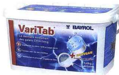
▲ Ce galet bicouche traite à la fois l'eau et le filtre. Il améliore ainsi les capacités de filtration du filtre à sable et assure une eau de piscine parfaitement saine et limpide. Révolutionnaire ! Bayerol, VariTab, 46 € environ les 5 kg.

piscine par excellence. En béton, elle procure la meilleure résistance aux intempéries, à la corrosion du temps et plus d'espace pour véritablement nager. D'un point de vue technique, il est possible de la faire construire sur tout type de sol à condition de faire appel à un professionnel.