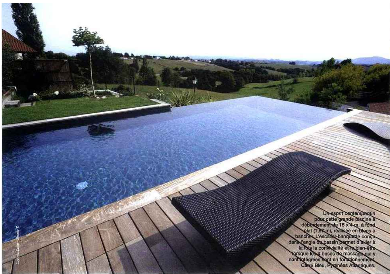
Un esprit contemporain pour cette grande piscine à débordement de 15 x 4 m, à fond plat (1,07 m), réalisée en blocs à bancher. L'escalier-banquette conçu dans l'angle du bassin permet d'allier à la fois la convivialité et le bien-être lorsque les 4 buses de massage qui y sont intégrées sont en fonctionnement. Carré Bleu, Pyrénées Atlantiques.