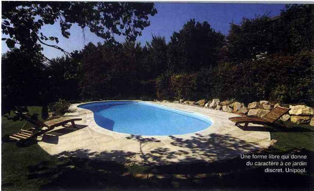
Une forme libre qui donne du caractère à ce jardin discret. Unipool.