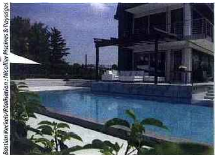
▲ Cette magnifique piscine à débordement est particulièrement bien intégrée à l'architecture de la maison, elle aussi très récente. Carre bleu

l'encadrement, pour une discrétion maximale quand le bassin à bulles ne fonctionne pas