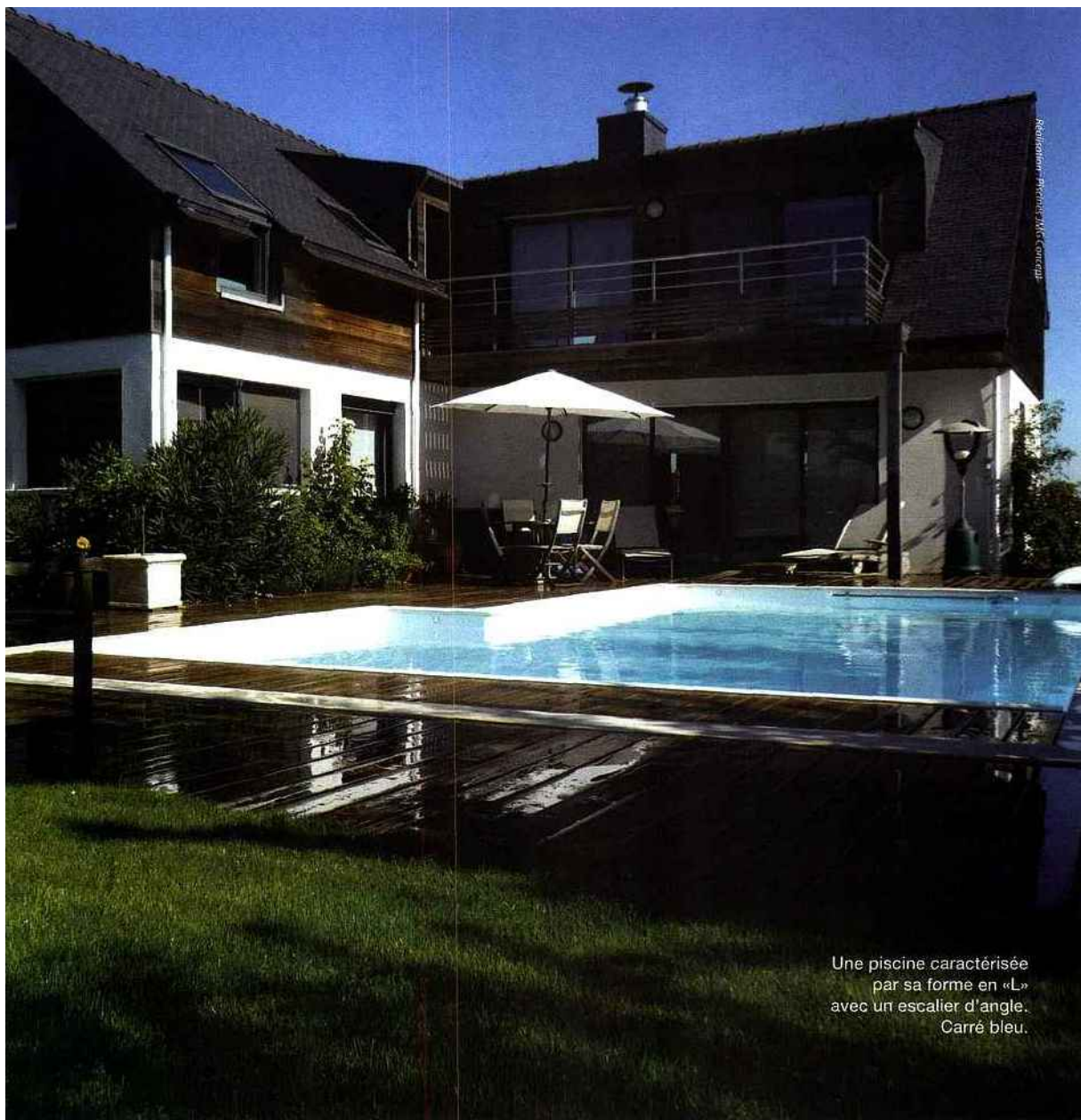
Une piscine caractérisée par sa forme en «L» avec un escalier d'angle. Carré bleu.

les tailles. Et elles ne ruinent pas forcément l'harmonie générale puisque certaines se noient dans le sol quand vous utilisez le bassin pour plus de discrétion. Concernant les abris, vous avez le choix entre de nombreuses options, allant de la structure haute en bois permettant de circuler à pied