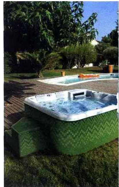
▲ Un bon moyen de disposer d'un spa sur mesure. Avec les panneaux d'habillage Lux Element (supports en mousse rigide prêts à carreler), MySpa Concept vous permet de réaliser un revêtement carrelé à votre convenance. SpaFrance, MySpa Concept.

de protection. Si la seconde solution peut s'avérer suffisante, un abri permet cependant d'enjoliver encore le