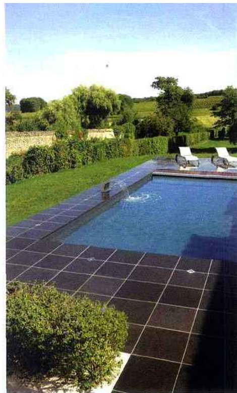
▲ C'est sans doute sa plage vêtue d'ardoise qui fait la différence ou alors ses belles dimensions ou peut-être sa lame d'eau... [Piscinelle] CR10, 19.570 € environ.

► Avec ses lignes sobres, douces et épurées, son assise en W vous convie à un moment de détente en solo ou en duo, en face à face ou côte à côte. Spafrance, Ilo.