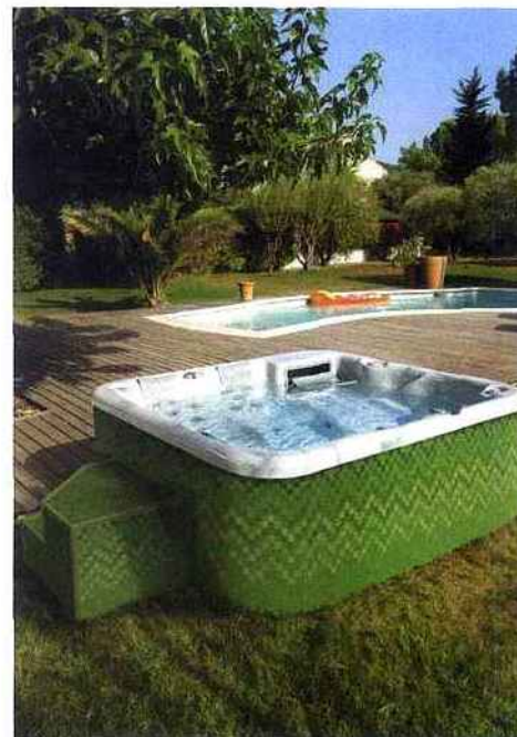
▲ Des panneaux d'habillage en Lux Element (support en mousse rigide prêt à carreler) offrent la possibilité de personnaliser votre spa simplement et facilement. Spafrance, My Spa Concept.