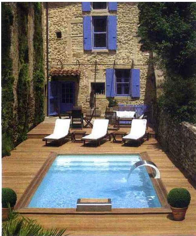
▲ Les piscines prennent également leurs quartiers en ville. Celle-ci est même Trophée d'Or de la piscine citadine avec son liner sable, sa lame d'eau, son escabanc et sa margelle en ipé. Piscinelle, CR4B, 7.335 € environ.