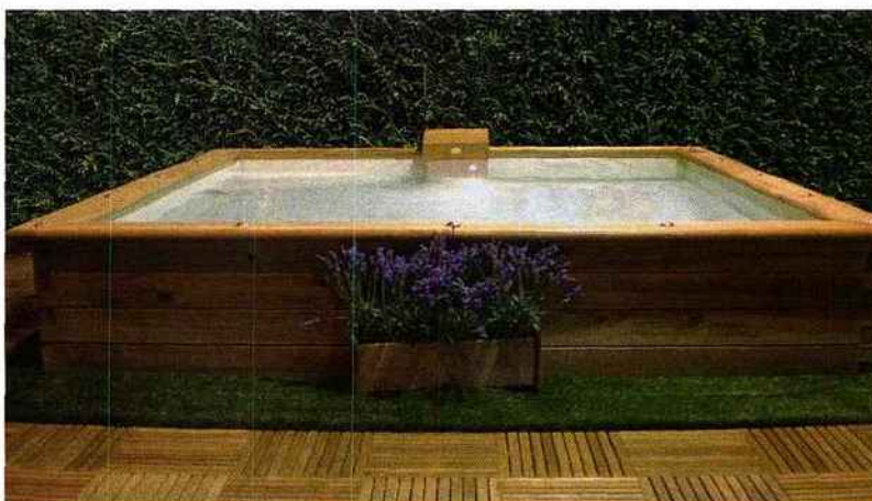
Voici le plus petit modèle de la marque Galion qui propose depuis 20 ans d'authentiques piscines faites de madriers de bois empilés sur des tirants en inox. En pin sylvestre traité en autoclave (classe IV), cette structure reçoit des margelles en bambou thermopressé. Plusieurs tailles et hauteurs possibles, pour des prix à partir de 8 600 €. Galion.

Du point de vue technique, les fabricants font appel au bois pour sa capacité à constituer une coque solide, capable de résister aux efforts de poussée s'exerçant sur le bassin. Sapin et pin du Nord (ou sylvestre) sont ici grandement sollicités. Ces derniers, en plus de leur coût limité, sont très réceptifs aux traitements par