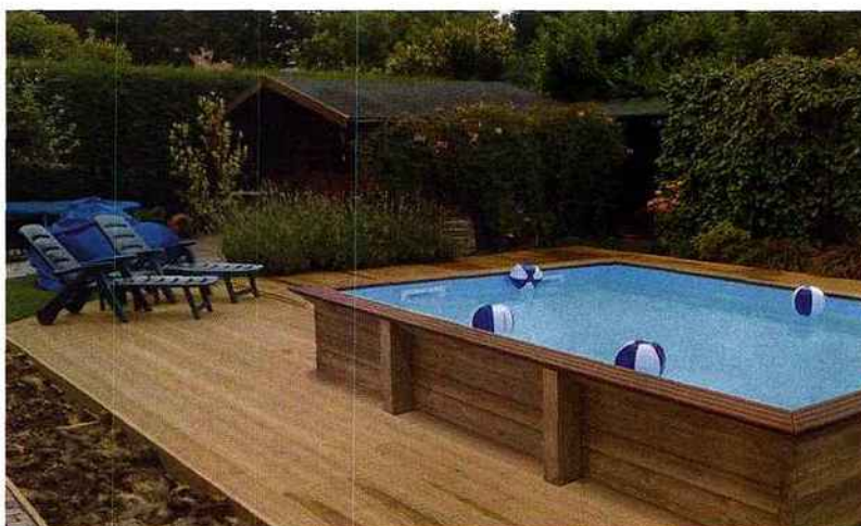
Des madriers en pin du Nord (traité classe IV) assemblés par un procédé qui a fait ses preuves : la queue d'aronde. Cet assemblage est renforcé aux angles par une tige en inox maintenant les éléments de bois solidement. Un nouveau bassin rectangulaire de 9,80 x 3,50 m a fait son entrée au catalogue cette année. Gardi Pool.

La chaleur monte et, pour gagner la plage, les bouchons s'allongent... La piscine fait cruellement défaut. Anticiper dès l'hiver l'implantation d'un bassin n'est plus une obligation car s'offrent à nous des modèles en kit , gonflables et même... en bois . Tour d'horizon.