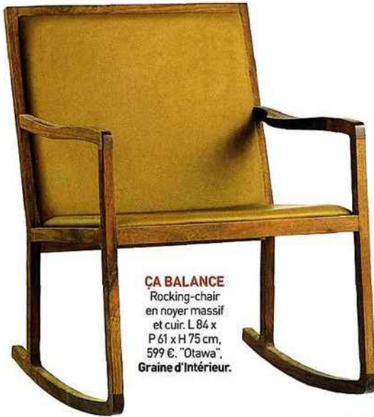
ÇA BALANCE Rocking-chair en noyer massif et cuir. L 84 x P 61 x H 75 cm, 599 €. "Ottawa", Graine d'Intérieur.