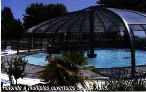
Rotonde à multiples ouvertures de Sun Abri3.