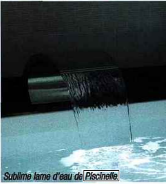
Sublime lame d'eau de Piscinelle