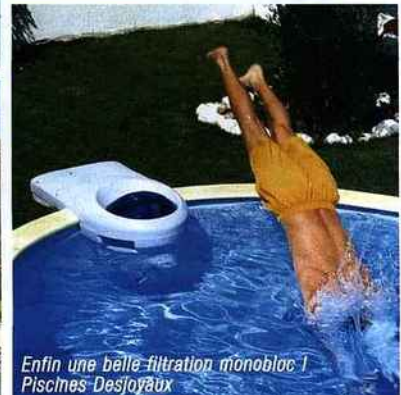
Enfin une belle filtration monobloc ! Piscines Desjoÿaux