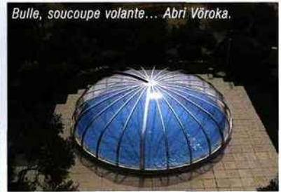
Bulle, soucoupe volante... Abri Vöroka.