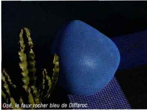
Osé, le faux rocher bleu de Diffaroc.