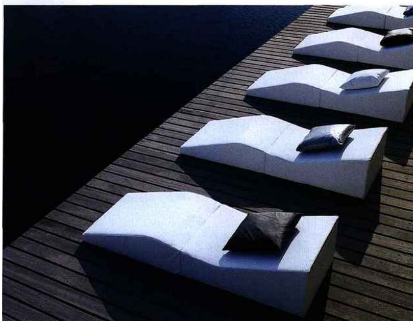
Chaise longue de jardin au design minimaliste... mais très confortable. Shape, design de Phillip Bro.

Puisque la technique, le pratique, les performances optimales et l'écologie sont aujourd'hui des « bases » auxquelles il n'est plus question de renoncer, même à bas prix, que nous reste t-il pour faire la différence... sinon le design ?