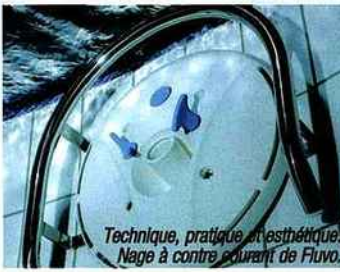
Technique, pratique et esthétique. Nage à contre courant de Fluvo. Luxueuse détente d'Hespéride.