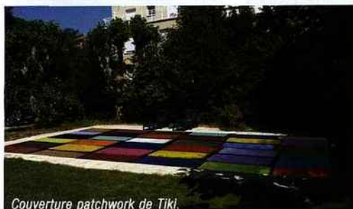
Couverture patchwork de Tiki.