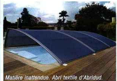
Matière inattendue. Abri textile d'Abridud.