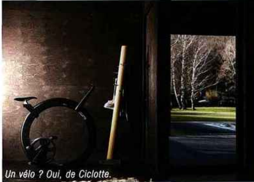
Un vélo ? Oui, de Ciclotte.