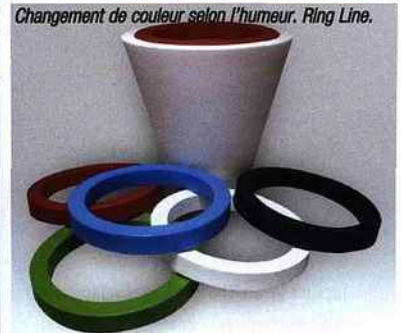
Changement de couleur selon l'humeur. Ring Line.