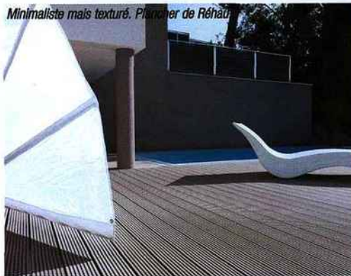
Minimaliste mais texturé. Plancher de Réhau.