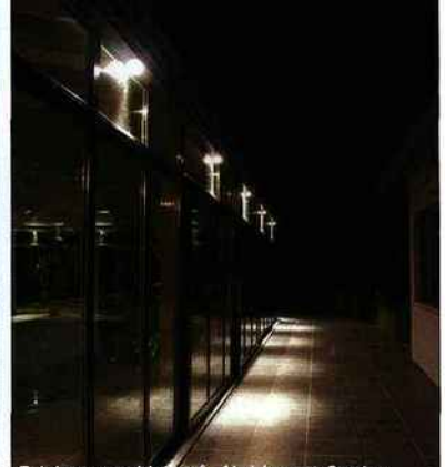
Eclairage sophistiqué. Abri Import Garden.