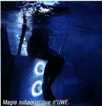
Magie subaquatique d'UWE.