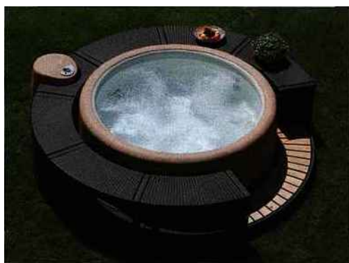
▲ Extrêmement léger, ce spa se déplace à volonté pour jouir des rayons du soleil ou de la chaleur d'un foyer. Une structure en mousse isolante évite les petits coups de froid. Softub

portent sur les jets massants, la «confortabilité» gages d'hydrothérapie et de remise en forme. Peu jolis avant, les spas ont connu beaucoup d'améliorations tant au niveau des couleurs que des formes. Des nouveautés qui répondent avant tout au désir des consommateurs conquis par le côté ludique de ces aménagements. Toile d'eau parasol et autres mobiliers très branchés finissent de transformer le jardin en une véritable pièce à vivre. Un lieu de détente que vous ne quitterez plus. ●