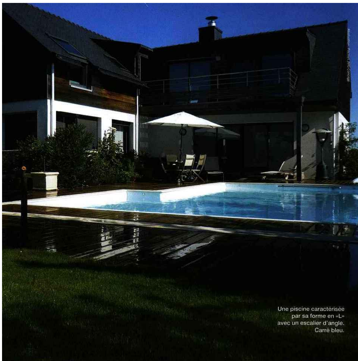
Une piscine caractérisée par sa forme en «L» avec un escalier d'angle. Carré bleu.

les tailles. Et elles ne ruinent pas forcément l'harmonie générale puisque certaines se noient dans le sol quand vous utilisez le bassin pour plus de discrétion. Concernant les abris, vous avez le choix entre de nombreuses options, allant de la structure haute en bois permettant de circuler à pied