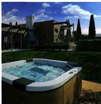
▲ En version à poser, ce spa trouve sa place sur une terrasse. À noter : la présence d'un système d'aromathérapie. Jacuzzi, Santorini II.

Décidez-vous tout d'abord au niveau de la forme : rectangle, carrée, ronde ou forme libre. Cependant, cette dernière option, à la mode, convient plutôt pour de petits espaces, de petits jardins pour créer une ambiance intimiste. Un grand bassin en L ou un très long rectangle apporte, lui, grandeur et stature.