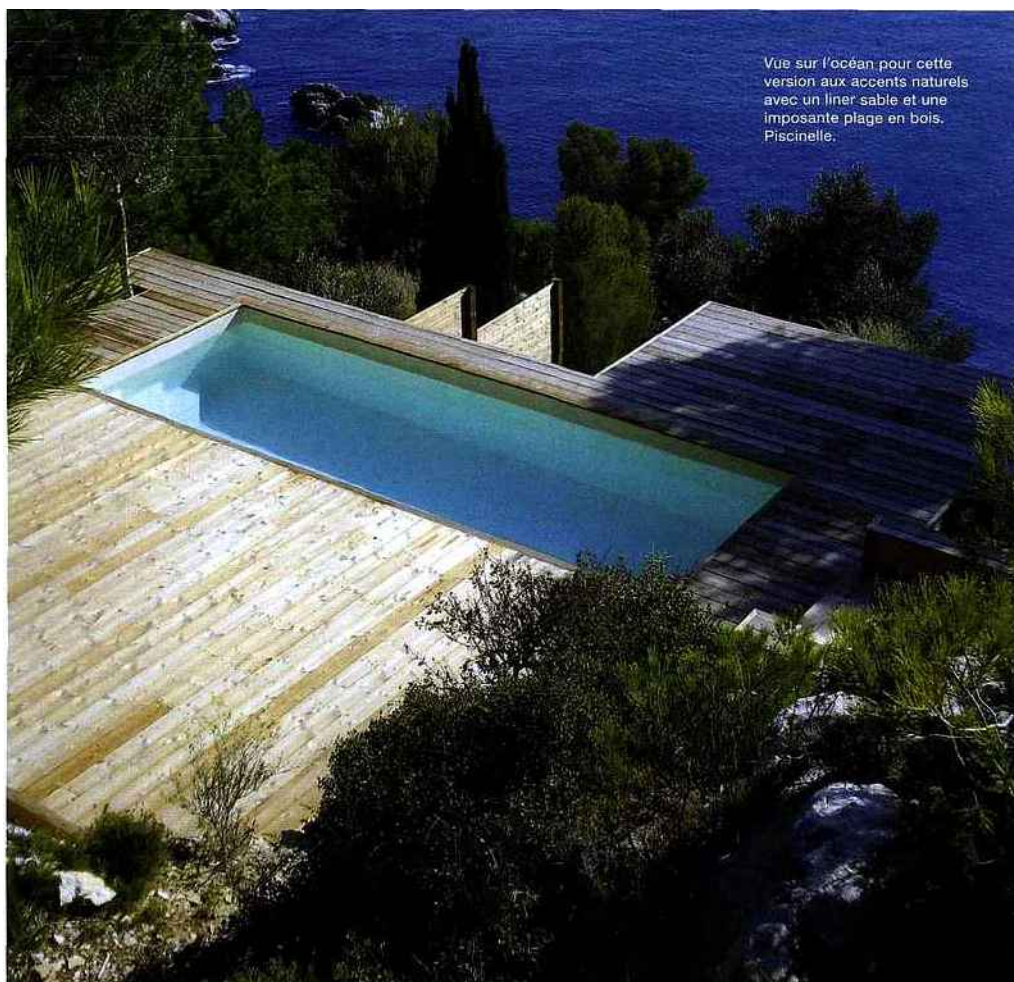
Vue sur l'océan pour cette version aux accents naturels avec un liner sable et une imposante plage en bois. Piscinelle.

dessin en mosaïque dans le fond pour donner au bassin un petit air gallo-romain. Quant aux pourtours, ils pourront être