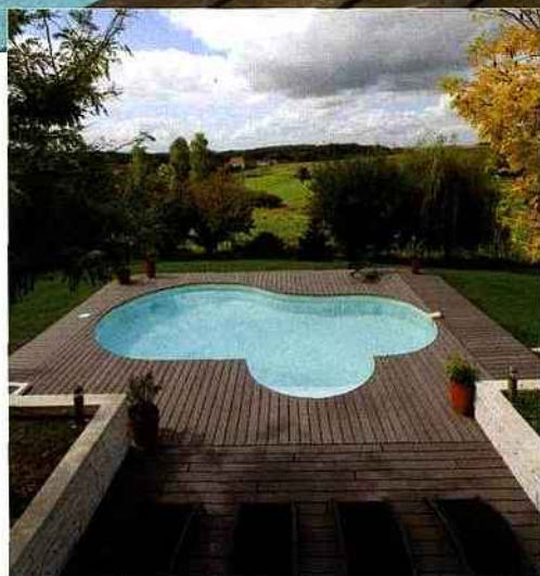
▲ Plage en bois et forme originale pour cette construction en kit primée trophée d'argent aux Trophées de la piscine 2011. Waterair, Madelène.

Implantation, orientation, type de construction, de revêtement, de couverture... face à toutes ces questions, mieux vaut faire appel à un professionnel dès lors que l'on souhaite voir son jardin parcouru d'une piscine digne de ce nom. Everblue.