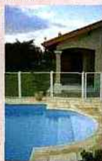
Horizal, barrières de piscine Neptunal.

garantissent une sécurité maximale. En effet, disponibles en 8 teintes standard, livrées en modules de 2 m ou sur mesure, elles acceptent toutes les configurations de bassin et s'adaptent aux ruptures de niveaux et aux pentes.