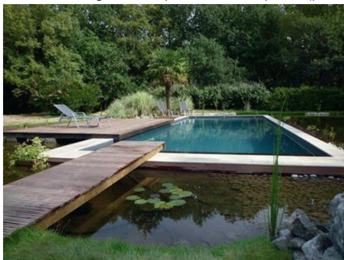
Euro Piscine Services

Tente "Touareg", toile imperméable sur pilotis (prix selon configuration, Aude Cayatte).