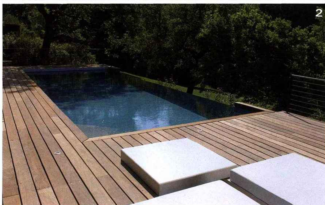
ARCHITECTE J.C. VIROT