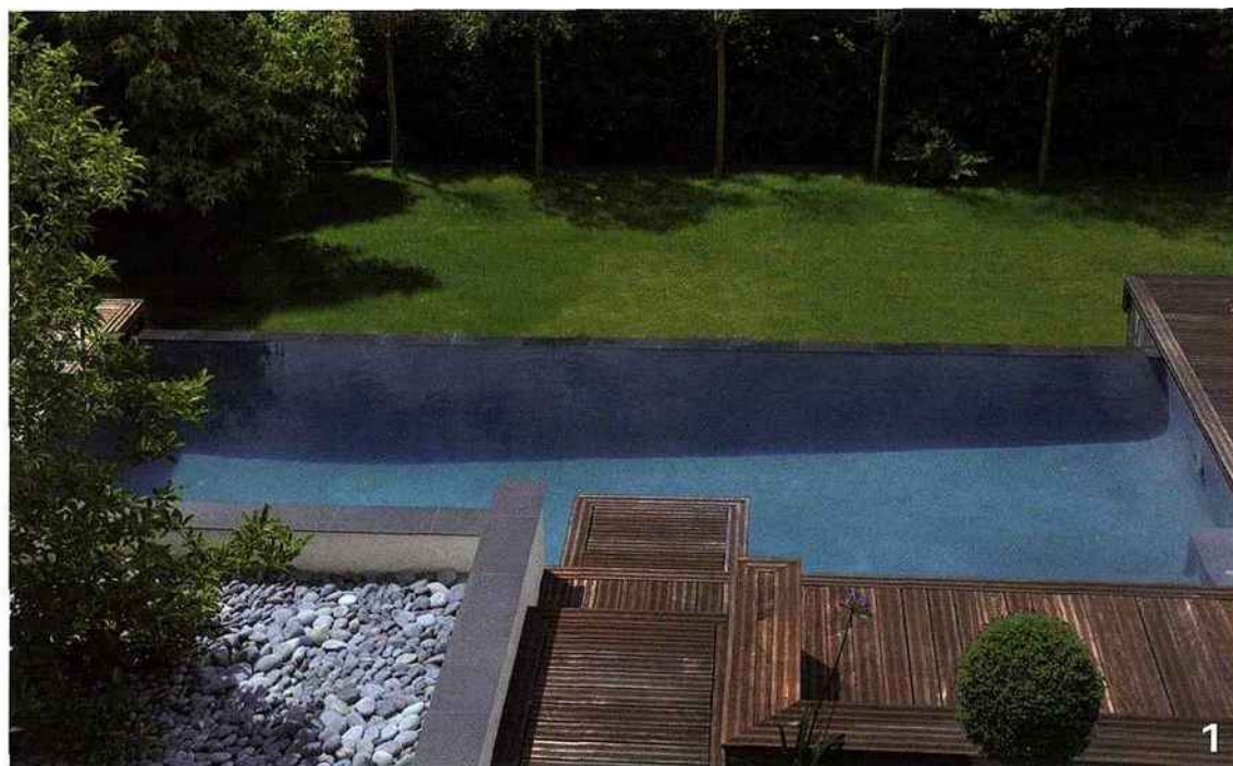
IN SITU ARCHITECTURE NICOLAS VERONIX-THÉLOT / ARBOR & SIENS MENNE DUBOURDIEU