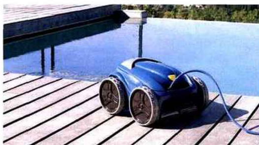
Intelligent, le VortexTM 4 4WD est la grande nouveauté du leader. Avec 4 roues motrices, il développe un confort et une facilité d'utilisation, lié à la technologie. Avec une interface digitale et une télécommande sensorielle, ce robot électrique propose 3 niveaux de filtration.

La piscine met l'accent sur une gestion automatisée, incorporant la domotique. Via des interfaces tactiles, vous restez connecté à votre piscine, idéal pour les maisons secondaires. Résultat, l'équilibre de votre eau est préservé, tout en contrôlant idéalement le pH, sans surplus de produits d'entretien et en réduisant les consommations. Magiline, Zodiac ou encore Bayrol ont mis un coup de projecteur sur ces systèmes, qui s'adaptent à vos piscines existantes. En ce qui concerne l'entretien, les robots sont de plus en plus pointus, tout en étant faciles d'utilisation. Zodiac a dernièrement développé un robot intelligent, porté par 4 roues motrices, le VortexTM 4, qui se plie, via une télécommande à toutes vos consignes. En effet, les robots deviennent aujourd'hui de plus en plus intuitifs. La qualité de l'eau est également