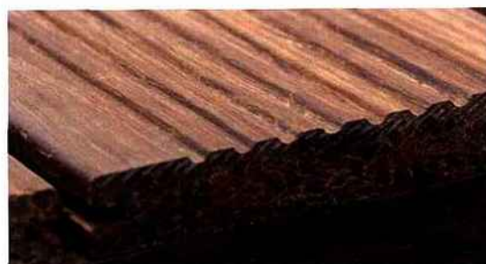
Bamboo France s'est vu décerner, sur le Salon Mondial de la Piscine et du Spa, le Trophée de l'Innovation, dans la catégorie Pool Eco Altitude - Dallages et Revêtements. Une alternative écologique et durable aux terrasses en bois tropicaux, matérialisée par un procédé naturel unique et breveté, garanti 10 ans.

Ils mettent en perspective la sécurité, mais également l'assurance d'une utilisation prolongée. Mais, la piscine voit également naître une autre tendance, matérialisée par les vérandas. Prolongement de la maison, plus besoin de sortir, pour profiter de son plan d'eau.