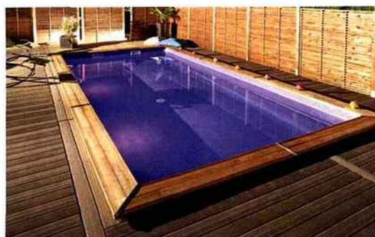
La piscine Maeva 800 s'enrobe d'une structure en pin marron classe 4 (bois pérenne garanti 15 ans). Sous forme de kit, prêt-à-monter, elle peut être enterrée, semi-enterrée ou hors-sol. Réalisation Piveteau Bois (Nivolas-Vermelle)