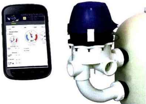
Récompensé lors des Trophées Salons Piscine et Aqualie, à Lyon, dans la catégorie Pool Eco Altitude, le PoolCop, développé par PCFR Poolcop, est un concept de piscine sur pilote automatique. Il gère entièrement votre plan d'eau, calculant la durée de filtration, tout en régulant le pH...