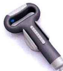
L'Easy Vis est une visseuse d'abris labellisée par l'Observatoire du Design. Elle a été conçue pour faciliter le vissage et le dévissage des molettes de fixations.