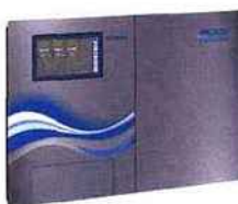
Le PoolManager® est un système de gestion globale de la piscine, pour le traitement de l'eau et le contrôle d'autres fonctions telles que les pompes de filtration, les jeux d'eau et le chauffage.