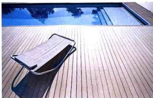
Spécialiste du bois composite, Laméo prône un mélange de bois et le polymère 100 % recyclable. Les lames deviennent hydrophobes, impuissibles, exemptes d'entretien et bénéficient du système Easyclip invisibles.