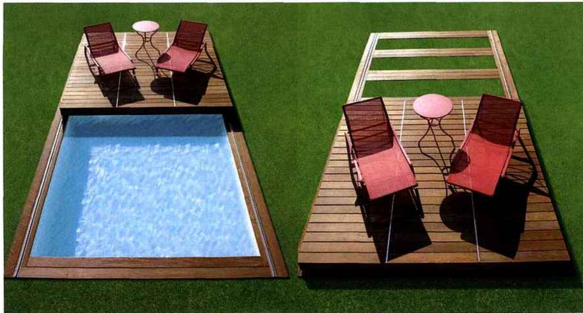
Dernière nouveauté, présentée lors du Salon Piscine et Spa, le Rolling Deck présente toute la subtilité d'une terrasse, couverture, piscine ! Un trois en un, qui, fermé, peut accueillir 200 kg/m 2 . Il s'ouvre avec une facilité déconcertante.