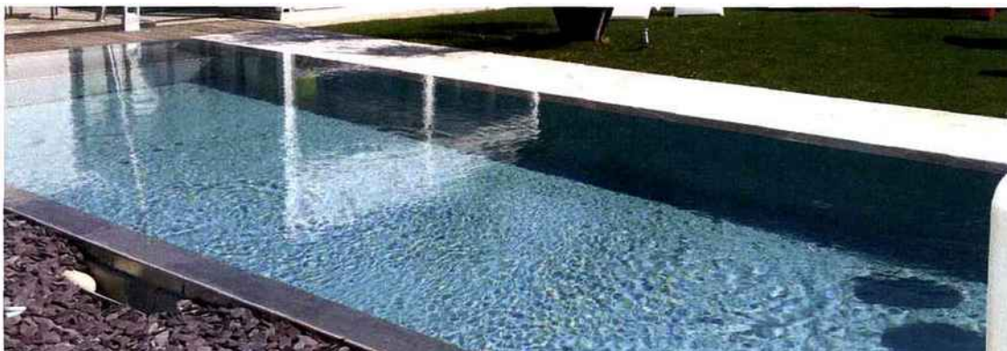
Spécialisé dans la piscine miroir, Refléa, fabricant lyonnais, a conçu ce petit bijou en composite et céramique à effet miroir. Dotée d'un système de débordement breveté, elle s'intègre parfaitement à l'environnement et peut se vanter d'être entièrement automatisée.

la belle vie, avec également des dimensions fluctuantes.