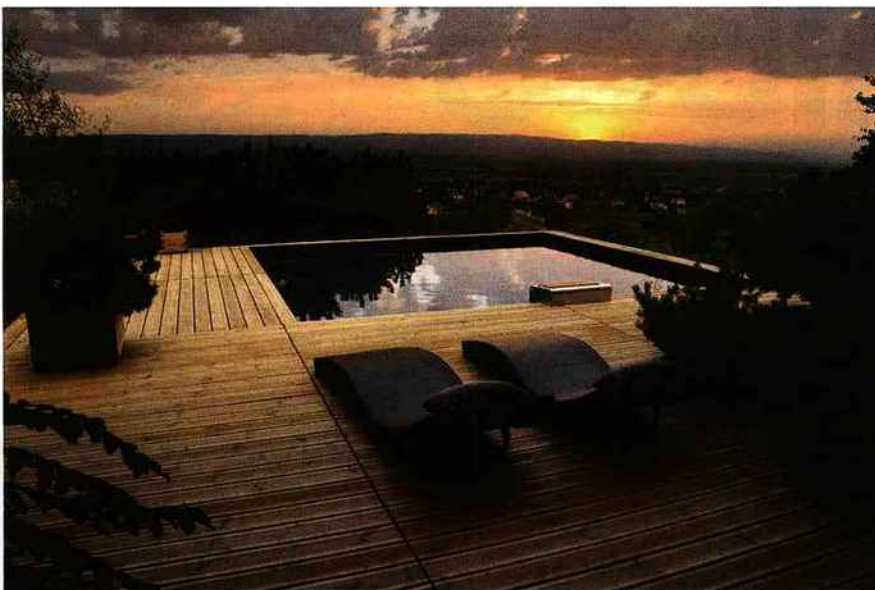
▲ Piscinelle a remporté le trophée d'or de la piscine 2012 grâce à ce modèle, un carré parfait (5,99 x 5,99 m) aux lignes tendues revendiquant une approche contemporaine de la structure, sublimée par une terrasse en ipé. Piscinelle, Bo6.