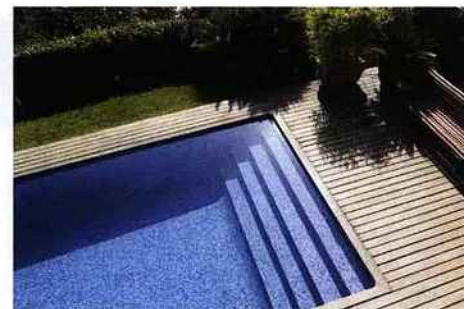
▲ Une longue et large piscine (6 x 12 m) idéale pour la nage avec son escalier tout en largeur et son revêtement mosaïque, garantissant une esthétique et un confort exceptionnels. Bassin rehaussé d'un entourage en bois exotique. Unibéo, Classic.

effet de serre. On trouve de l'acacia, du châtaignier, du pin maritime, du hêtre, du chêne et du douglas. En France, les forestiers respectueux de l'environnement sont labellisés PEFC.