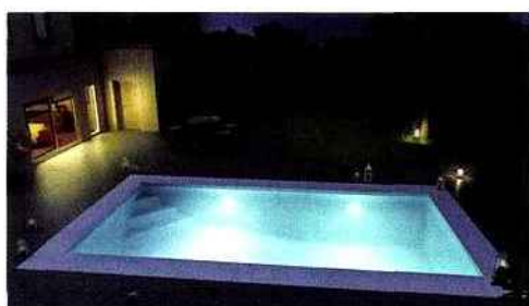
▲ Une piscine spécialement conçue pour savourer les plaisirs de l'eau en famille ou entre amis. Composée de 2 plages de profondeurs différentes, ce modèle réunit dans un même bassin 2 espaces de jeu. Aquilus, concept Dooplex, à partir de 8.999 € environ.

Lippi, clôture et portillon Decorella® 3.