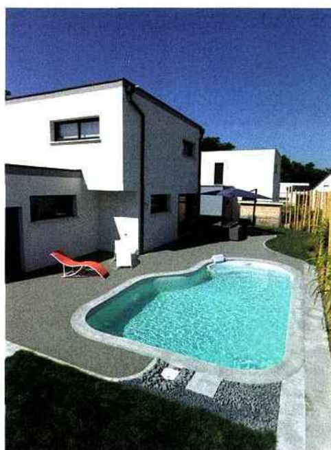
▲ Ce modèle a été récompensé lors des derniers Trophées de la Piscine, dans la catégorie «Piscine citadine inférieure à 30 m 2 de forme libre». Une ligne contemporaine, une piscine compacte et bien équipée grâce à son escalier intégré de série. Waterair, Cléa.

referme. Cette solution vous permet de joindre l'utile à l'agréable : votre espace piscine est sécurisé et vous disposez d'une jolie terrasse. Dans l'optique de gagner de la place toujours, les petites structures se font de plus en plus pratiques et économiques, dans un design qui n'a rien à envier