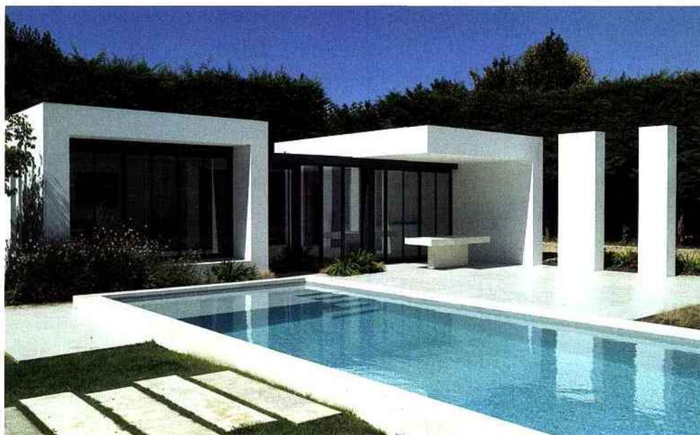
Carré Bleu : PISCINES PYRÉNÉES ATLANTIQUES à Biarritz (SN). Architecture : Delphine Courme.

▲ Un design très contemporain pour cette piscine d'architecte de 17 x 3,80 m, avec une sélection soignée de matières et de couleurs (revêtement en membrane armée gris clair, et margelle en béton ciré) en parfaite osmose avec l'environnement paysager. Carré Bleu.