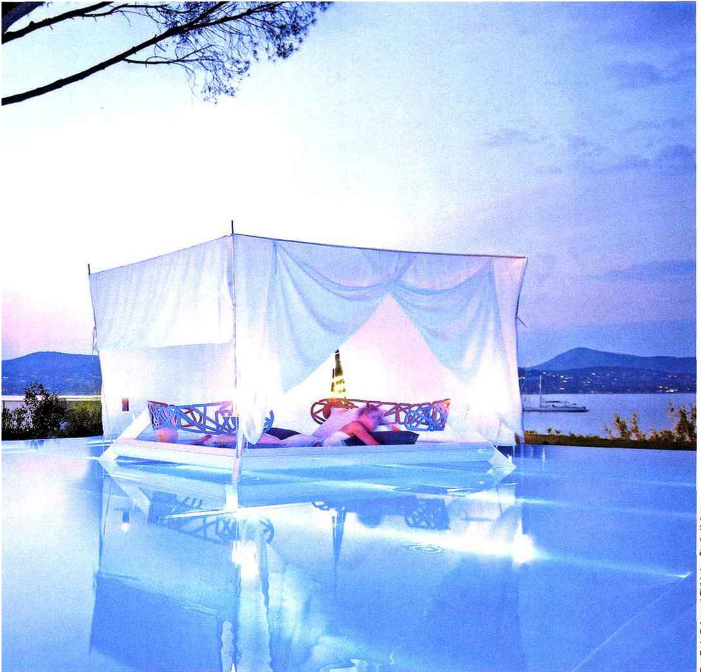
Ego Paris

B eauté, magie, quiétude... La piscine confère un charme fou à une propriété et s'impose comme un espace de vie convivial. Véritable valeur ajoutée, ses fonctions et ses caractéristiques tendent cependant à évoluer. « Le traditionnel bassin rectangulaire de 8 x 4 mètres ou de 10 x 5, qui était encore il y a quelques années le cœur du marché, a été délaissé, constate Arthur Choux, responsable du développement chez Piscinelle . (conception et commercialisation de piscines). Au profit, notamment de la mini piscine, idéale pour les petits espaces et les terrains