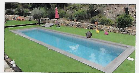
Couloir de nage Odalia, 3 x 11 m, 1,50 m de profondeur, disponible en finition miroir et/ou à débordement. Génération Piscine , 16.200 € environ.

Parce que la piscine est le reflet d'une personnalité, le choix d'une construction sur-mesure devient une évidence pour de nombreux consommateurs. Chez Diffazur, chaque projet débute avec une question simple : quel usage allez-vous faire de votre piscine ? Les équipes redoublent de créativité et d'ingéniosité pour