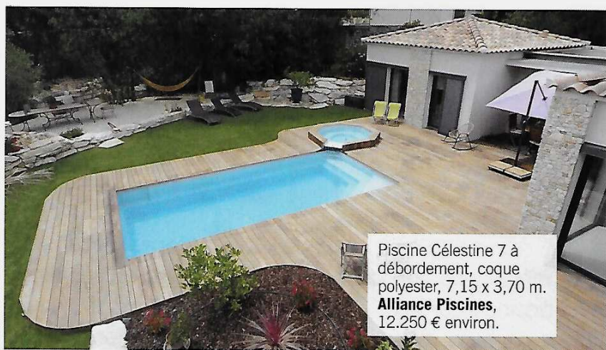
Piscine Célestine 7 à débordement, coque polyester, 7,15 x 3,70 m. Alliance Piscines , 12.250 € environ.