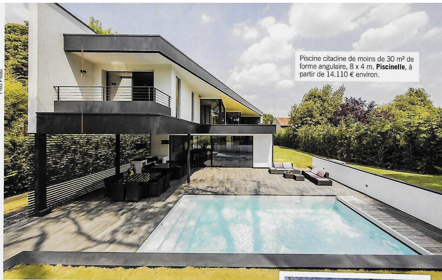
Piscine citadine de moins de 30 m 2 de forme angulaire, 8 x 4 m. Piscinelle , à partir de 14.110 € environ.